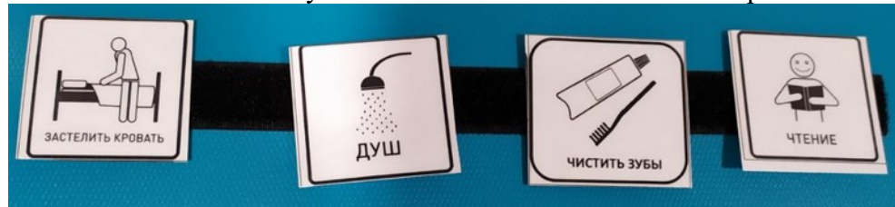
Рис.2 Расписание дня с карточкой «Чистить зубы»

• В течение дня обсуждать, что все чистят зубы, играть в чистку зубов куклам и игрушечным животным, читать книги о чистке зубов. Обсудить последствия отказа от чистки